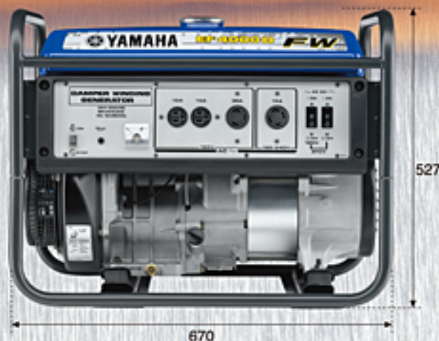
EF4000FW / EF4000DFW